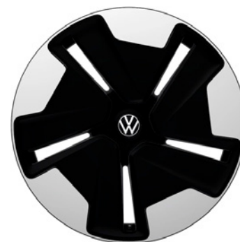
05 - Bromberg