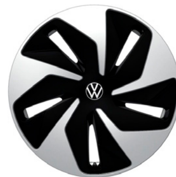
02 - Venlo