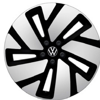
01 - Tilburg