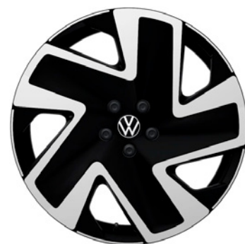
04 - Solna