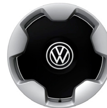
03 - Stockton