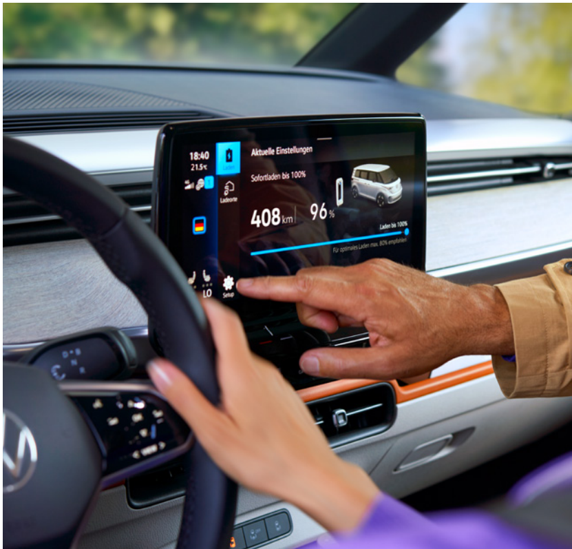
La vettura raffigurata è puramente indicativa.