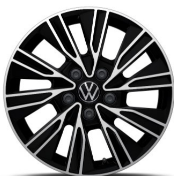
Opzionale Cerchio in lega in Nero DUNDROD 17"