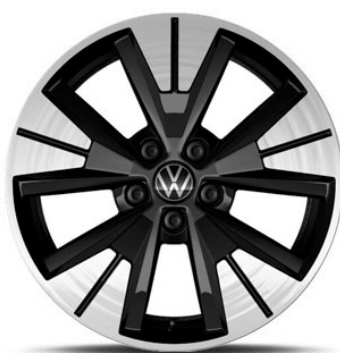
Opzionale Cerchio in lega in Nero HALMSTAD 19"