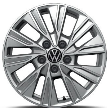
Serie per Space Cerchio in lega in Argento DUNDROD 17"