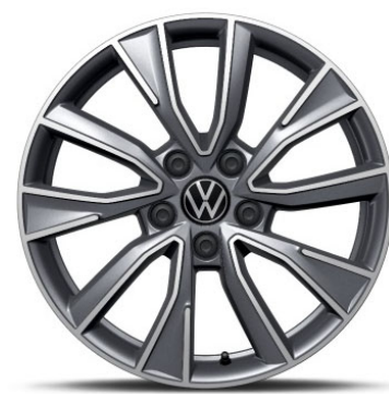
Opzionale Cerchio in lega in Antracite TOSHIMA 18"