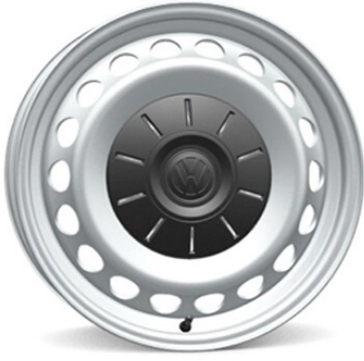
Serie su e-Crafter Cerchio in acciaio 16"